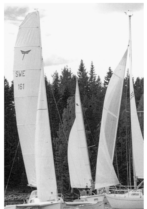
Den 14 augusti 2005 firades St Barthélemydagen i Pitea med bl a den återupptagna Regattan på programmet. Bilden är tagen precis efter startskottet.

I december är det 28 år sedan fullmäktige i Pitea formellt fattade ett beslut om ett vänortsförhållande mellan Pitea och St Barthélemy. Under åren har de personliga kontakterna varit manga och betydelsefulla men det tog nästan 28 år innan Pitea bildade en vänortsförening. En vänortsförening som den 14 augusti 2005 genomförde sitt första officiella arrangemang, helt i linje med de stadgar som finns antagna för föreningen, att "arrangera aktiviteter i Pitea i syfte att sprida kunskap om och stärka banden med St. Barthélemy."